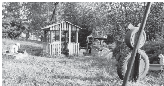
Детская площадка у дома № 57

Ли, Дмитрия Пепеляева и Влада Симонюка, которые воплотили их идеи в жизнь и построили для детворы этого дома прекрасную детскую площадку, состоящую из песчицы, качелей, скамеечки, макета автомобиля. Площадку украсил симпатичный бурый мед-