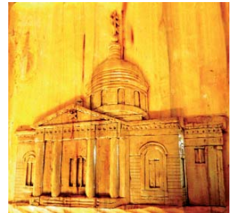
Церковь Рождества Богородицы в г. Чёрмозе

Не менее яркая у мастера галерея старинных храмов Ильинского района. Она просто завораживает. Есть среди них и такие, которых в реальности уже не существует. Он много работал в архивах, чтобы восстановить их ушедший образ, собирая по