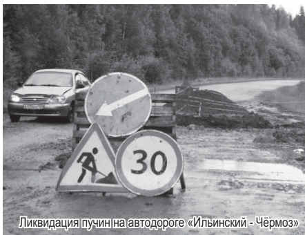
Ликвидация пучины на автодороге «Ильинский - Чёрмоз»

Значительной поддержкой муниципалитетов, считаю, стала наша договорённость с Правительством Пермского края о передаче некоторых дорог с районного уровня на краевую.