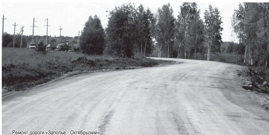
Ремонт дороги «Заполье - Октябрьский»

тали модель финансирования... И вот, благодаря работе главы региона, из бюджета Российской Федерации нам выделено более 9,5 миллиарда рублей, мы подписали концессионное соглашение с инвестором и в этом году приступаем к строительству. Ориентировочная дата завершения строительства – 2021 год. Причём мы смогли договориться, что для жителей региона проезд по мосту будет бесплатным.