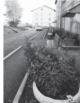
Ул. Зелёная выглядит теперь не хуже городского двора

В доме № 61 жильцы тоже очень довольны новой автодорогой и тротуаром. Здесь жильцы сами благоустроили цветочные клумбы, посадили многолетние цветы, убрали портящий всю картину забор,