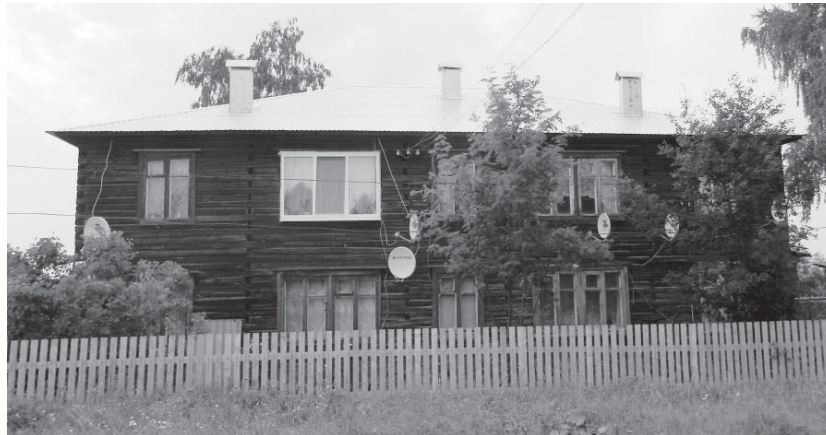
Дом № 29 по ул. Дзержинского воскрес из ветхих с новой крышей

тели вышли с инструментами и восстановили старые конструкции. И что пока-зательно, среди них было