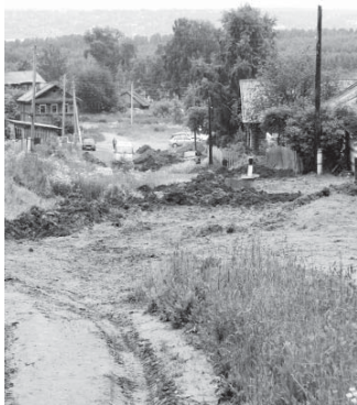
Прокладка водопровода в д. Мироны Сретенского сельского поселения