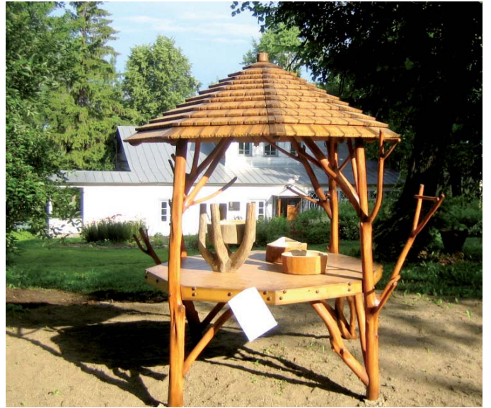
«Кормушка» для читателя в Саду-сказке

Сотрудники библиотеки уверены, что экологическая тропа станет катализатором самой разнообразной работы: «зелёных уроков», природоохранных акций, флешмобов, увлекательных экскурсий для посети-