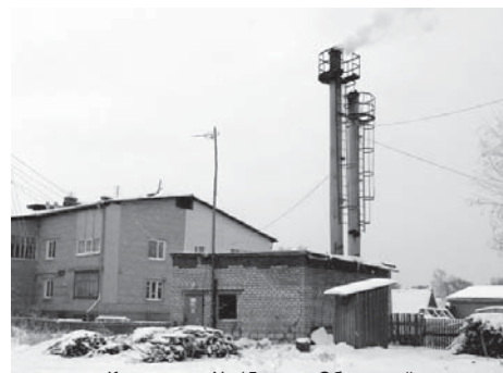
Котельную № 15 на ул. Оборонной в п. Ильинском, возможно, выведут из эксплуатации

В то же время главы заверили, что подготовка к зиме проходит по графику. Паспорта готовности жилых домов оформляются, проводится плановый ремонт водопроводов и теплотрасс. Так, в с. Сретенском