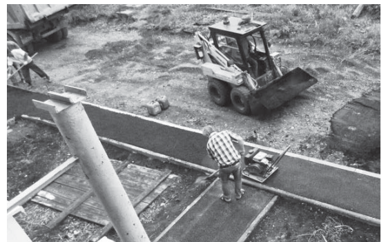
Благоустройство двора одного из домов на ул. Зелёной

тели выжили с инструментами и восстановили старые конструкции. И что пока-зательно, среди них было